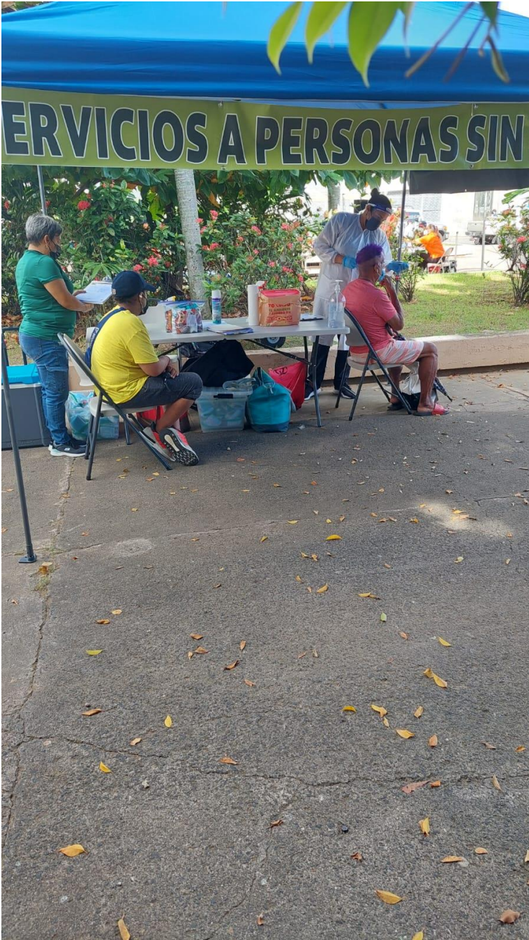
Fotos de Actividades de alcance comunitario