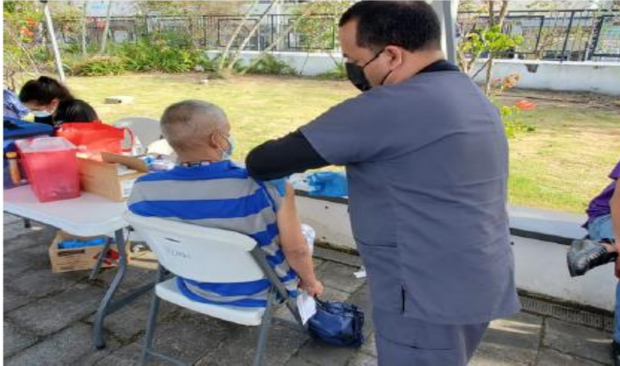
El evento se realiza hoy en la Plaza de la Convalecencia en Río Piedras.

Personas sin hogar reciben servicios en otra edición de "Noches sin techo".